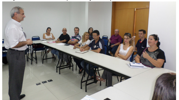
Plantão de orientações sobre o Plano de Qualificação Profissional

A consultoria do SINDIMETAL/PR ainda esclareceu dúvidas quanto à adequação ideal de cursos oferecidos pelas empresas e também sobre a cláusula 75 da CCT que trata da porcentagem de contribuição dos empregados para a prática de ações voltadas à requalificação do profissional.