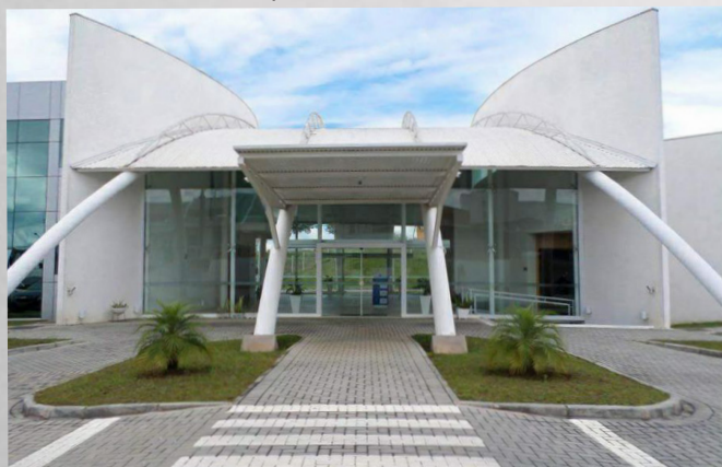
A gestão consolidou a modernização da sede do sindicato.

Defendendo o conceito de que o associativismo e a união de forças entre a categoria impulsionaria o crescimento do setor no Paraná, a direção promoveu duas edições do evento denominado Café da Manhã Empresarial.