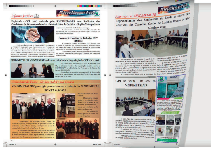
O jornal SINDIMETAL/PR traz informações importantes sobre temas relevantes do segmento metalmeccânico

Além disso, é de responsabilidade do setor a elaboração do Jornal SINDIMETAL/PR - publicação de periodicidade bimestral que oferece informações importantes e aprofunda temas relevantes sobre o segmento, além de divulgar notícias e atividades desenvolvidas pela entidade.