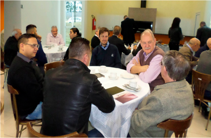
Nas duas edições do Café Empresarial SINDIMETAL/PR, os empresários estreitaram laços com a entidade sindical.

O grande objetivo dos encontros foi estreitar laços entre os industriais da cadeia produtiva do setor metalmeccânico e a entidade sindical que os representa.