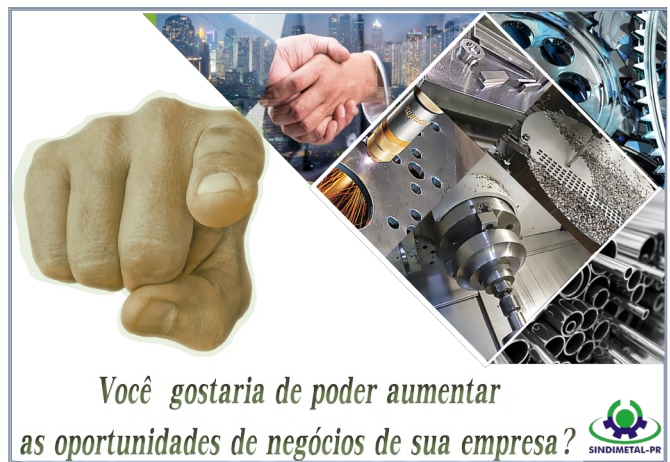
Cadastro de Fornecedores SINDIMETAL/PR