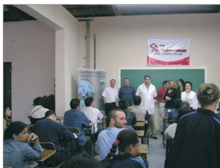
Aula Inaugural - Alunos da 1ª turma de Mecânica Básica.

Com carga horária de 208 horas, distribuída em 52 dias úteis, seu conteúdo programático conta com oito disciplinas, entre elas: aulas de Português e Matemática Básica, bem como as matérias técnicas de Leitura e Interpretação