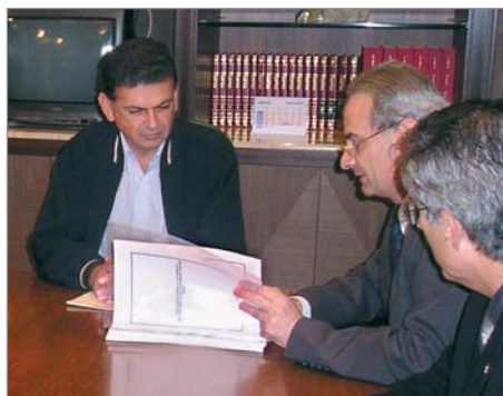
Karam entregando as reivindicações ao Prefeito de São J. dos Pinhais

Com cerca de 40 empresários e o apoio do Senai de São José dos Pinhais - que avalia a possibilidade de investir em mais cursos, equipamentos e laboratórios que venham a