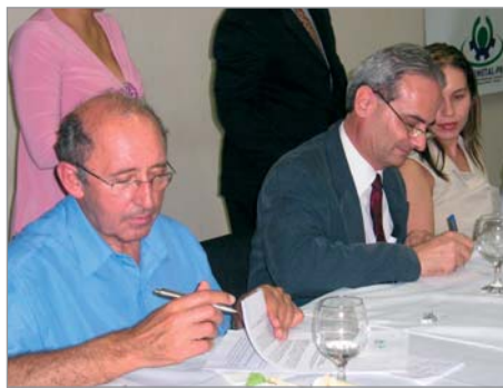
Assinatura do termo de parceria.

Com o objetivo de proporcionar ao deficiente atualização e reciclagem permanente para que tenham igualdade de condições no mercado de trabalho, o projeto é coordenado pelo Sindimetal-PR. Abrange Curitiba e região metropolitana, beneficia pessoas com necessidades especiais (físicas e auditivas) - cadastradas nas entidades parceiras e familiares de trabalhadores das empresas associadas ao Sindimetal-PR -, atuando na capacitação profissional, cidadania, geração de trabalho e renda, bem como na inclusão social desses cidadãos. "Queremos colocar todas as pessoas com necessidades especiais dentro de nossas fábricas.