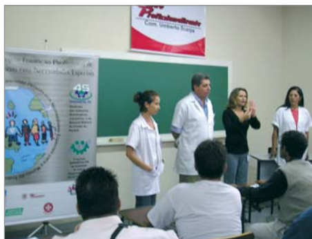
Professores ministrando a aula inaugural.

O primeiro curso oferecido nesta nova etapa do projeto, de Mecânica Básica Industrial, está em andamento desde o dia 4 de abril, e irá até 20 de junho. Sua turma é composta por 37 pessoas, a partir de 18 anos de idade, de ambos os sexos, e com deficiências auditivas e físicas.