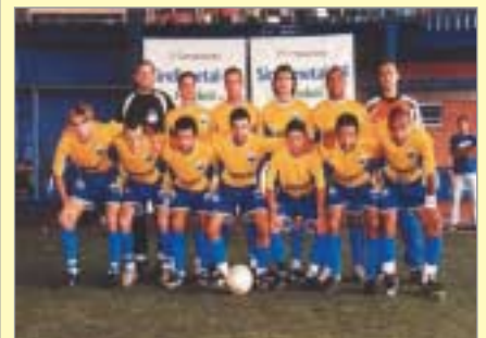
- Equipe Bosh - Campeã de Futebol de Grama Sintética.