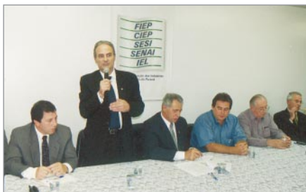
• Mesa composta por representantes das entidades convenentes e demais autoridades.