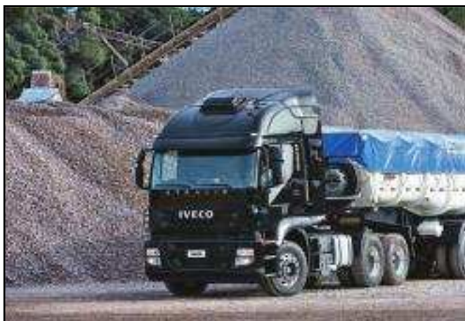
O novo Strallis NR, extrapesado da Iveco, demandou 18 meses para o seu desenvolvimento na fábrica de Sete Lagoas (MG)