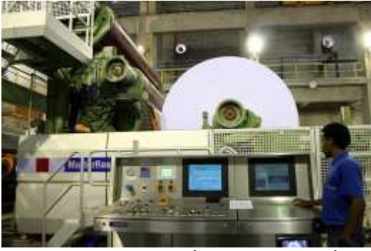
Atividade industrial é retomada após a crise

Brasília - O otimismo dos industriais brasileiros ficou estável em março. O indicador chegou a 67,7 pontos, 0,1 ponto abaixo do índice registrado em fevereiro deste ano. É o que mostra o Índice de Confiança do Empresário Industrial (ICEI), divulgado nesta quarta-feira, 24 de março, pela Confederação Nacional da Indústria (CNI). Apesar do recuo, o índice permanece 8,9 pontos acima da média histórica.