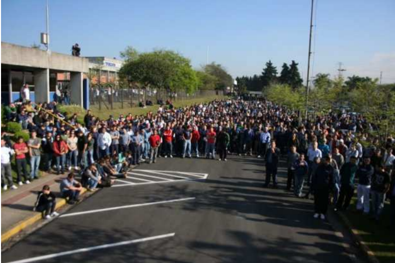
Funcionários da Volvo pararam por duas horas na frente da fábrica: sindicato diz estar à espera de contraproposta

Metalúrgicos, petroleiros e bancários se mobilizam para melhorar seus ganhos em relação aos anos anteriores. Dia foi de paralisações e negociação.